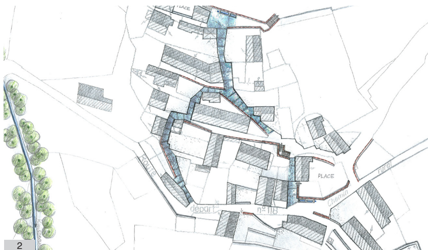
2. Plan d'aménagement des rues en pas d'âne d'Eget, réalisé par le CAUE des Hautes-Pyrénées