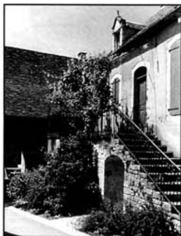
Ensemble rampe, garde-corps, tonnelle

Dans l'architecture rurale traditionnelle des XVIIIème et XIXème siècles, les portails, garde-corps et tonnelles sont dans la plupart des cas réalisés en métal. Dans certaines régions, le Ségala par exemple, il existe des solutions mixtes fer-bois.