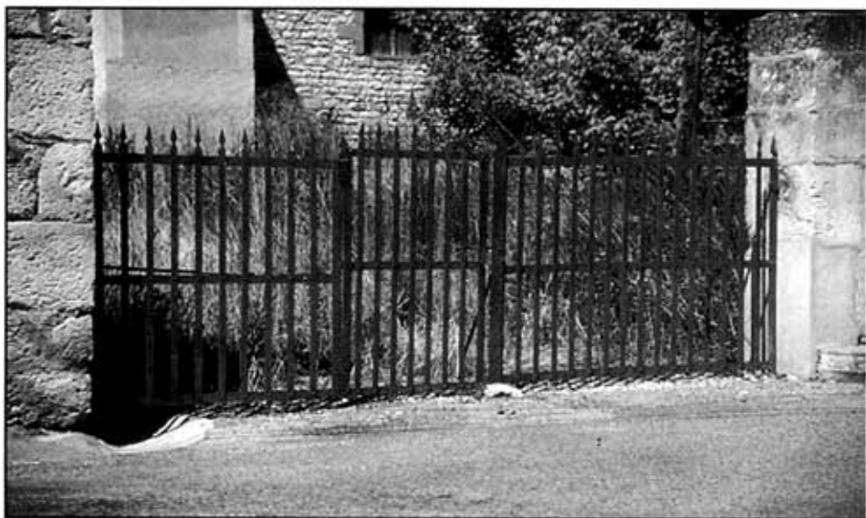
Quelques termes usuels