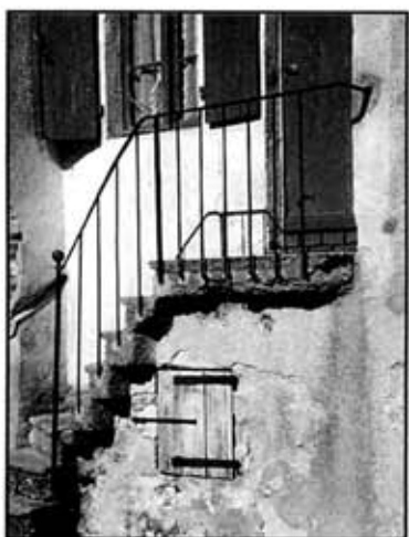
La discrétion du fer

Ces dispositions traditionnelles offrent une grande diversité dans les motifs et une finesse dans les assemblages. Elles méritent d'être conservées ou restituées car elles témoignent de l'art et de l'imagination des forgerons.