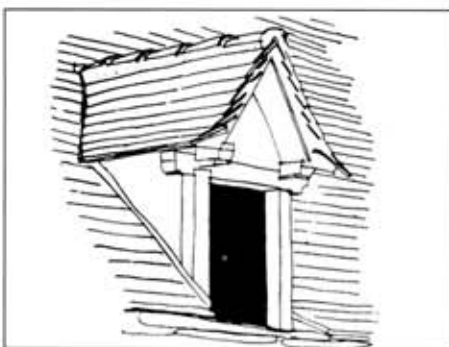
Lucarne à bâtière