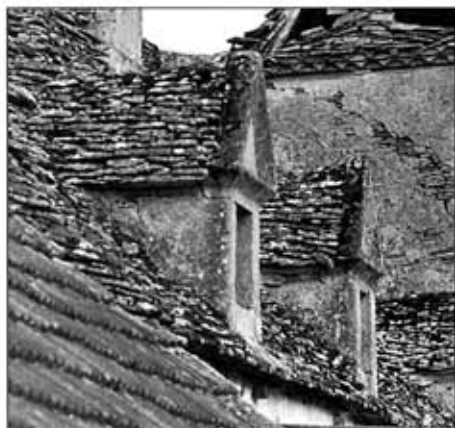
Lucarne à fronton

Sur les toitures de certaines habitations, il existe un type de lucarne qui à l'origine, était entièrement réalisé en pierre, avec une ouverture de dimension modeste : il s'agit des lucarnes à fronton, parfois ornementées.