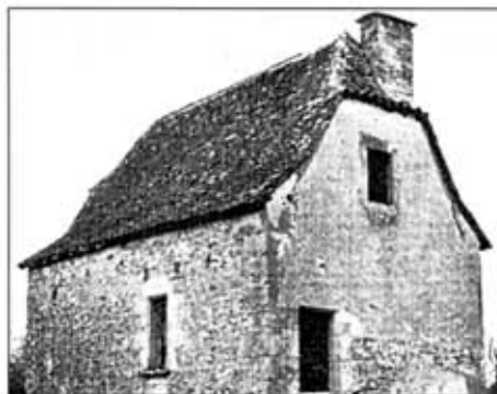
Percement en pignon