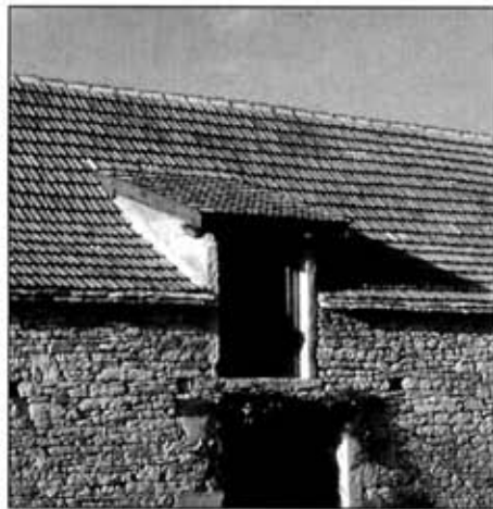
Lucarne fenière de grange