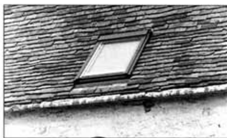
Chassis de toit

Des châssis de toiture modernes permettent d'apporter un éclairage pour les combles habitables sans modifier le volume du toit. La dimension conseillée (0,78m. x 0,98m.) s'intègre parfaitement, toutefois il est conseillé de les axer si possible sur les ouvertures du niveau inférieur.