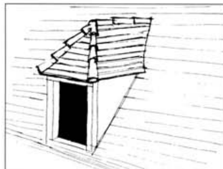
Lucarne à capucine