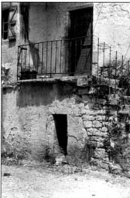
Garde - corps pour balcon

Les ouvertures dont la hauteur d'allège est inférieure à 0,90 m. doivent être équipées soit d'une barre d'appui, soit d'un garde-corps afin d'avoir une protection réglementaire de 1,00 m. (cas des lucarnes fenêtrées ou d'anciennes portes à l'étage transformées en porte fenêtrée).