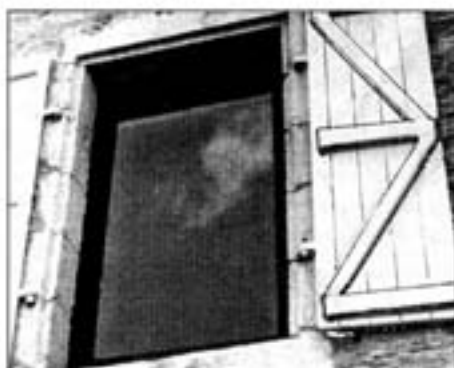
Fenêtre à un seul vantail

Elles seront en bois, de type ouvrant à la française, généralement à deux vantaux divisés chacun en trois carreaux. En cas de double vitrage l'emploi de fenêtres à un seul vantail sans petits bois est préconisé.