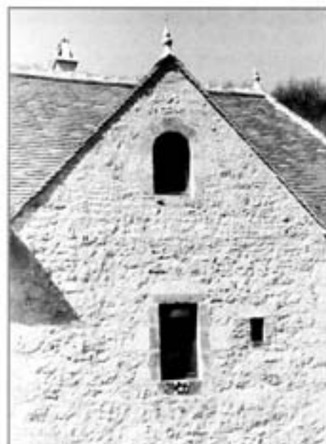
Petites ouvertures vitrées

Les "fenestrous" seront du même type que les fenêtres mais avec un seul carreau. Pour les plus petites (œil de bœuf, ouvertures des combles, etc...) un vitrage fixe sur dormant bois permettra d'en augmenter l'éclairage.