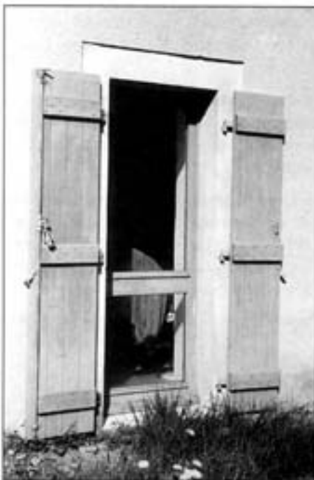
Volets sur porte - fenêtre

Des protections réalisées par des grilles en fer peuvent éviter la pose de volets. Il convient de choisir des modèles anciens comme par exemple "Testripe-loup" dans le cas d'une petite ouverture.