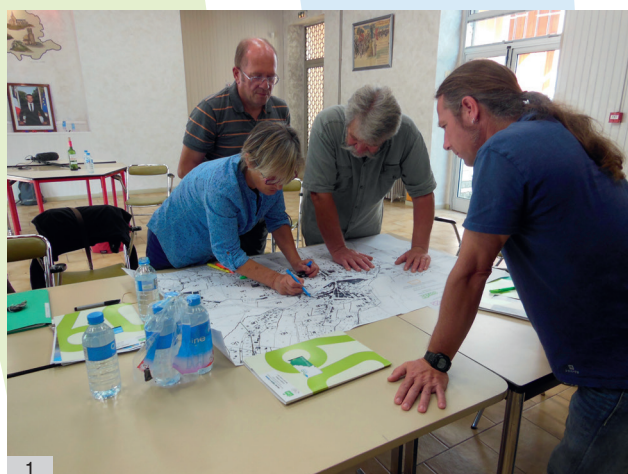
1. Atelier sur l'OAP

L'ensemble des échanges a été filmé et est à valoriser sur les sites internet des partenaires et les réseaux sociaux.