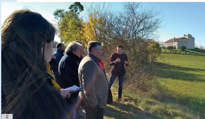
1. Le paysage de Lalbenque (vu depuis Ausset)