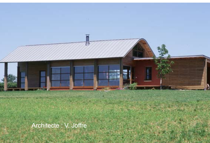
Architecte : V. Joffre