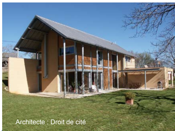
Architecte : Droit de cité

Vous pouvez rencontrer un architecte conseiller, gratuitement en prenant rendez-vous directement au Conseil d'Architecture d'Urbanisme et de l'Environnement de l'Aveyron 05 65 68 66 45