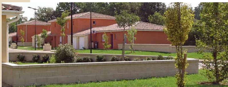
"Le Pré Vert" à CAUSSADE Arch. : B. SALOMON

Dans le cadre de documents d'urbanisme (PLU, lotissements, ...), de périmètres de protection Monuments Historiques ou de chartes paysagères, l'édification de clôtures peut être réglementée. Des prescriptions sont définies afin de guider chaque propriétaire privé vers une solution garantissant un résultat plus homogène de l'image du futur quartier. Ainsi, peuvent être précisées la nature et la teinte des matériaux, la hauteur des murets ou des grillages, la palette végétale adaptée.