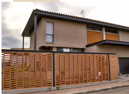
Mur-claustrea en terre cuite

Dans un contexte d'habitat dense, la clôture, tout en marquant les limites de la propriété et en protégeant l'intimité, doit assurer la continuité de l'espace public.