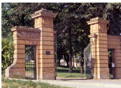
Entrée de château