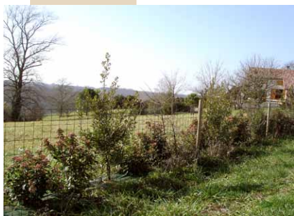
Clôture grillagée et haie champêtre