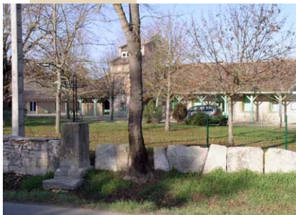
Clôture en dalles levées (voir fiches "Restaurer les murets en pierres sèches" éditées par l'APICQ)

L'opacité de la clôture ou sa transparence, sa nature minérale ou végétale, sa juxtaposition plus ou moins en continu avec les clôtures voisines, son intégration discrète dans un environnement rural, sont autant d'éléments à prendre en compte dans le choix des matériaux constituant l'ouvrage et dans le savoir-faire de leur mise en œuvre.