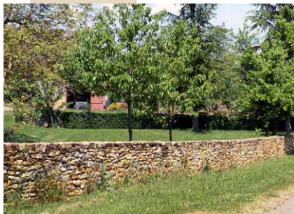
Mur de moellons appareillés