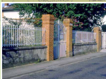
Clôture en ferronnerie 1900