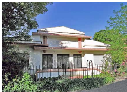
Pavillon 1930 aux détails "art déco"