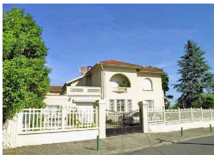
Villa bourgeoise 1940-1950