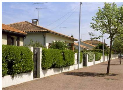
Alignement de clôtures végétalisées

L'enjeu est de rechercher une certaine diversité sans être trop hétérogène et une relative harmonie sans être trop banal, pour concilier lieu privé et espace public.