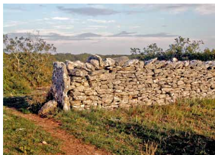
Muret de pierres sèches

Des murs d'enceinte et portails imposants des châteaux aux clôtures bâties en brique, pierre ou ferronnerie, jusqu'aux haies végétales libres ou taillées, tous ces types de clôtures participent à la diversité et à la spécificité des paysages urbains et ruraux du Tarn-et-Garonne.