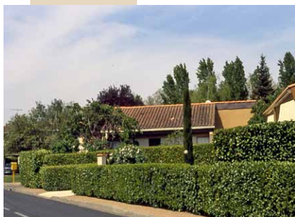
Haie taillée formant clôture