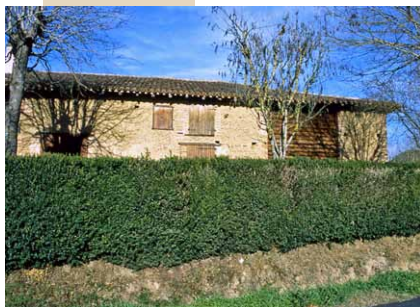
Clôture de buis taillé

Les nouvelles constructions sont souvent implantées, dans le paysage rural, en rupture avec les modes traditionnels d'occupation de l'espace : la clôture peut être un moyen pour une meilleure insertion du bâti dans le paysage existant. La restauration des anciens murets est mieux adaptée que la construction d'un mur neuf, davantage conseillée en milieu urbain.