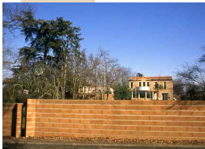
Mur bâti en parpaings teintés