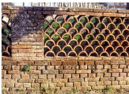
Appareillage de briques et claustras de terre cuite