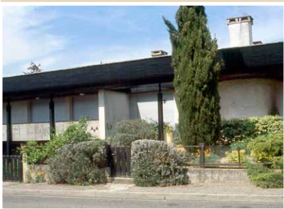
Style contemporain "années 70" Arch. : Atelier Montalbanais d'Architectes AMA

La transition entre l'espace extérieur public et l'espace privé peut se faire plus en douceur, en tenant compte à la fois des caractéristiques architecturales de la maison, des spécificités de l'environnement urbain ou rural et des besoins : préservation visuelle, protection sécuritaire, rôle écologique d'une haie par exemple.