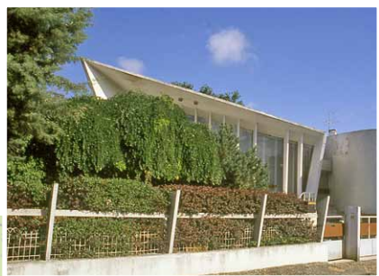
Maison "années 60" en béton armé Arch. : J. ALGAYRES

Destinée à délimiter une propriété et à préserver un lieu, la clôture a également un rôle de représentation sociale. Un regard sur quelques exemples significatifs du XX e siècle permet d'illustrer le fait que "la clôture est indissociable de la maison".