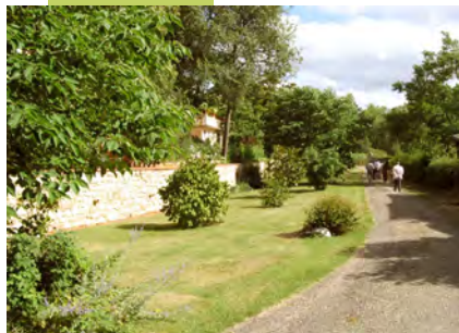
Pelouse, arbustes, arbres

Le végétal offre une diversité d'espèces et une richesse de formes, souvent méconnues, donc peu employées.