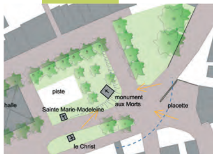
Place de la Halle à Larrazet