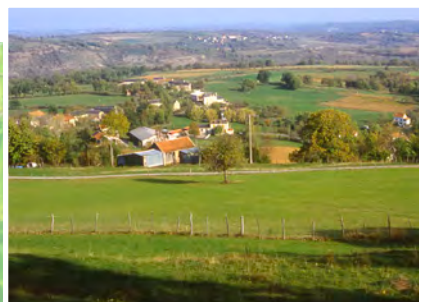
Terreforts du Rouergue à Castanet

Aujourd'hui, avec l'extension de nos villes et l'urbanisation de nos campagnes, un phénomène de "banalisation végétale" se développe, de la parcelle privée à l'espace public, jusqu'à l'échelle du grand paysage. Mieux connaître l'identité végétale du Tarn-et-Garonne à travers ces entités paysagères, c'est mieux l'apprécier et la respecter, pour mieux la préserver ou la développer.