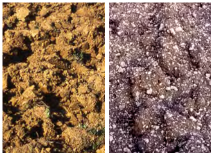
Boulbène des terrasses, calcaire des coteaux

Suivre une démarche environnementale est nécessaire pour la préservation de nos entités paysagères et la prise en compte du végétal comme élément vivant, dans une notion de développement durable.