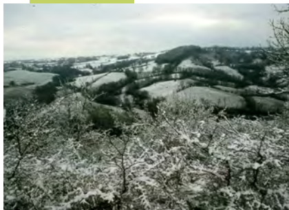
Vallée de la Bonnette sous la neige

Le végétal, par définition "élément vivant généralement chlorophyllien et fixé au sol...", est cependant considéré trop souvent comme une composante statique du paysage. Or son caractère vivant est réel. Il a besoin des quatre éléments fondamentaux pour se développer : la lumière, l'air, l'eau, la terre. Il est présent dans l'espace rural et urbain depuis toujours ; il remplit de multiples fonctions liées aux besoins de l'homme.