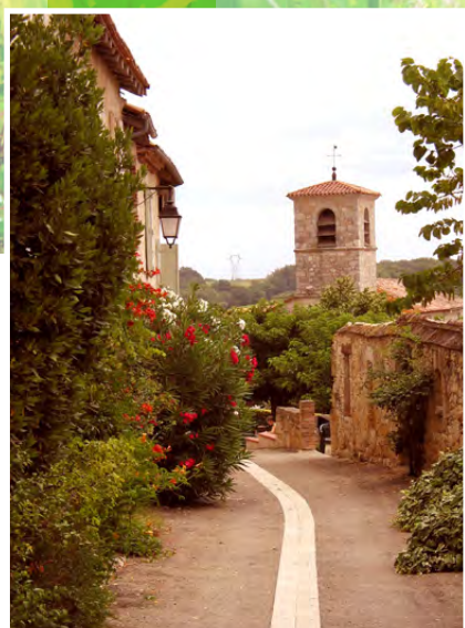
Rue végétalisée à Bardigues

Son rôle n'a cessé d'évoluer dans le temps. Planter pour fournir du bois de chauffe, de construction ou de la nourriture pour le bétail, le végétal a aussi une fonction écologique de protection climatique pour les cultures et les hommes.