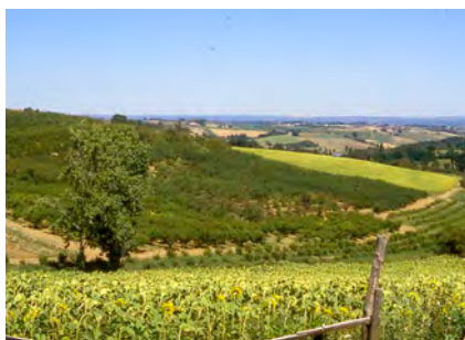
Coteaux de Bas Quercy à Mirabel