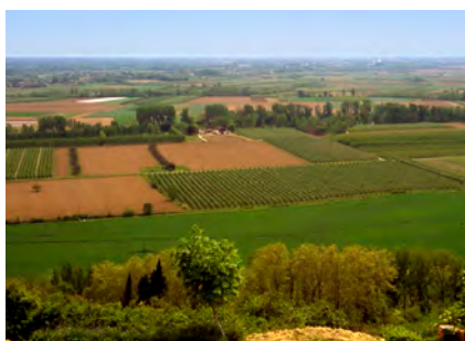
Plaine de la Garonne depuis Lafrançaise

Le Tarn-et-Garonne, département situé à la confluence de larges vallées et au point de rencontre de plusieurs régions naturelles, offre une grande variété de paysages. Le végétal est une des composantes essentielles à leur identité.