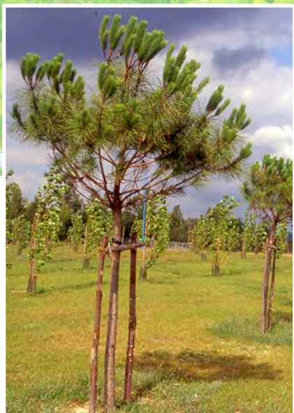
Plantation récente de pins parasols