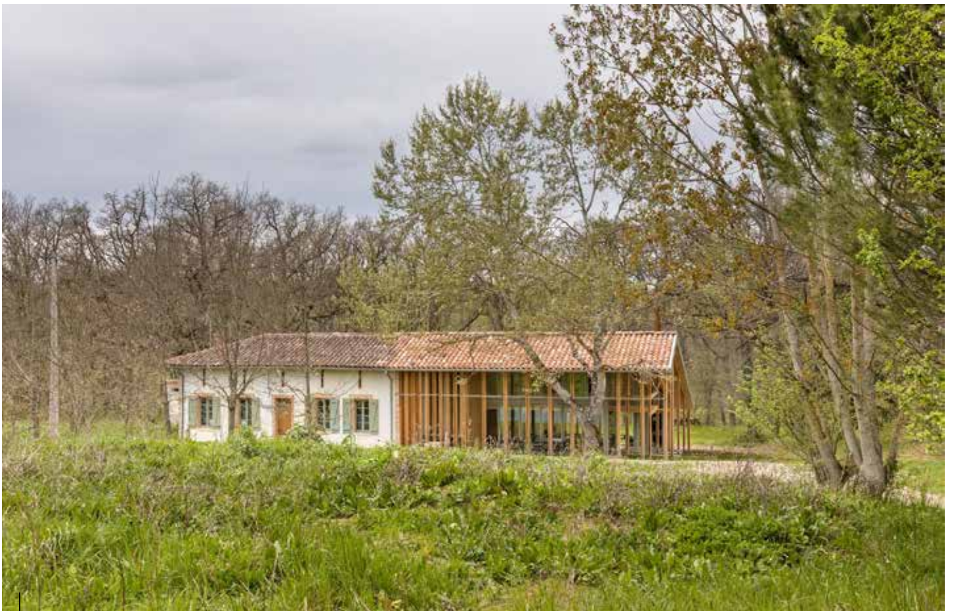
Vue de la façade principale

La maison se cache, en recul. Un seul espace intérieur, continu et transparent, dévale la pente en trois niveaux suivant la déclivité du terrain. Cinq lignes de poteaux portent la couverture, rythment l'espace et font seuil entre salle à manger, séjour et bibliothèque. L'intérieur offre une ambiance chaleureuse et épurée en privilégiant la connexion à la nature par de larges ouvertures sur le paysage et l'utilisation du bois en résonance avec la forêt voisine.