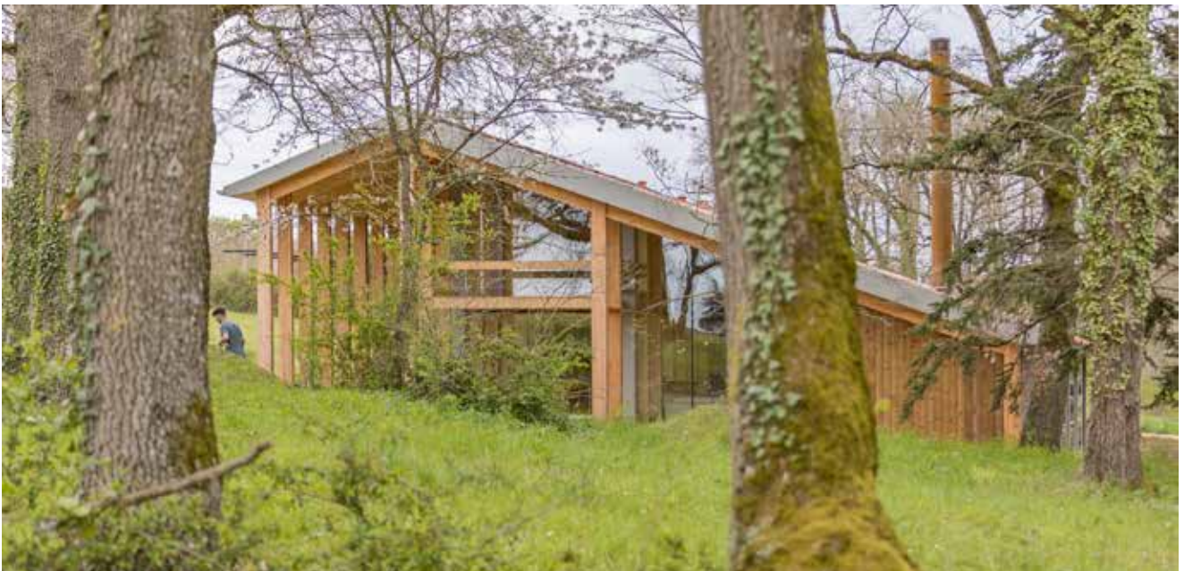
Vue de la «réinterprétation du hangar» en prolongement de la maison existante