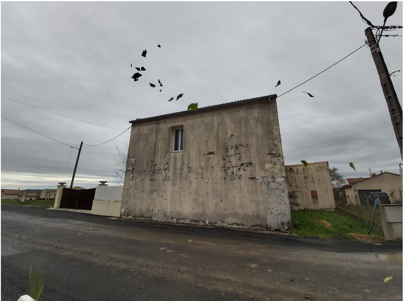
Photo prise pour le parallèle entre les feuilles déchirées et la maison craquelée : les feuilles symbolisent la nature détruite par la pollution, la maison rappelle la société qui se détruit...