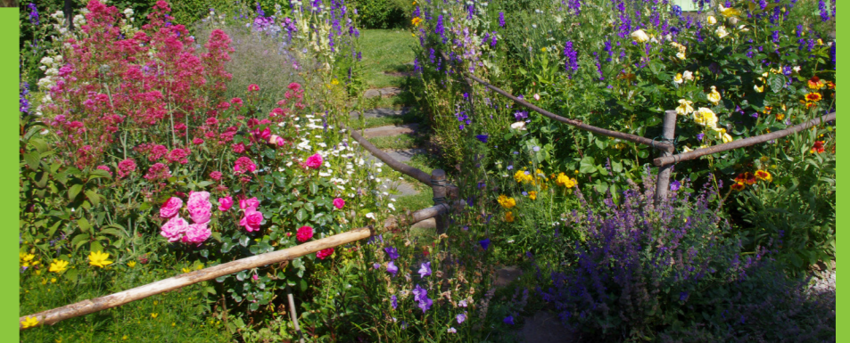
Valériane - Mme CARVENC - Le Puch

Les campanules poussent en terrains très variés, au soleil. Elles fleurissent plutôt l'été (de juin à août) et atteignent 0,5 à 1 mètre de hauteur. Il existe de nombreuses variétés à floraison bleue ou blanche, à fleurs en clochettes simples ou doubles.