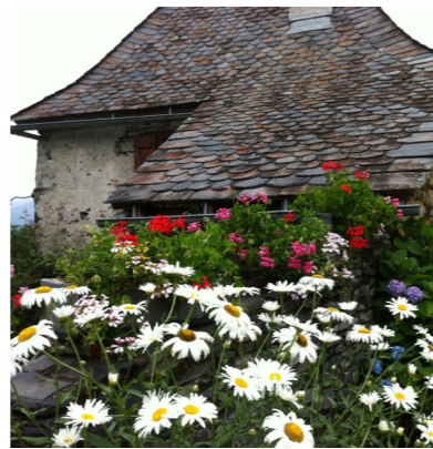
Saint-Jean du Castillonais

La vocation, le caractère des lieux et sa fréquentation permet d'apprécier le type d'activité, d'animation ou d'usage que l'on souhaite donner.