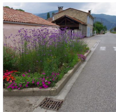
Verveine - Saint-Paul de Jarrat

Parmi les montagnardes, les plantes suivantes sont particulièrement robustes et intéressantes :