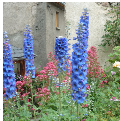
Delphinium - Mme Duboy - Goulier