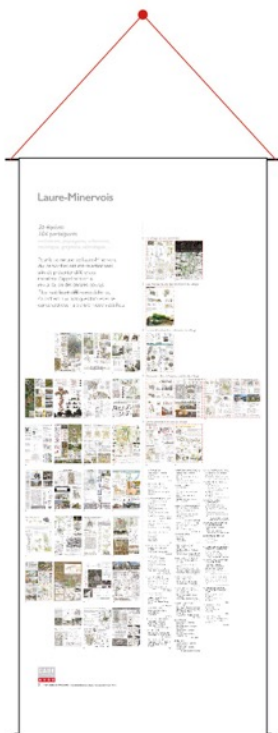
Montage sur pointe ou crochet sur un mur (en intérieur)