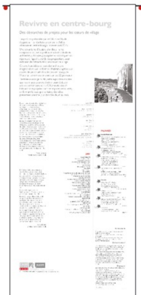
Montage sur pointe ou crochet sur mur ou grille (en intérieur)