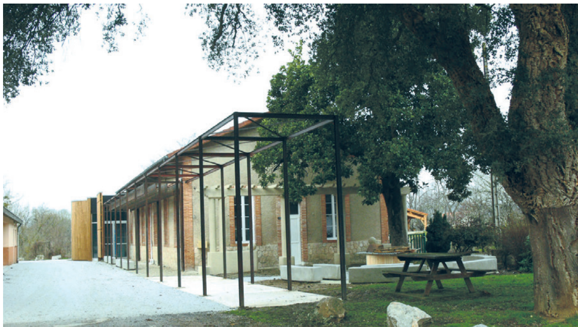
La pergola, élément d'accroche qui annonce l'équipement public et guide vers l'extension

L'ancienne gare de Briatexte, transformée en maison d'habitation, accueille aujourd'hui les nouveaux locaux de la médiathèque, résultat d'une volonté de réinvestir et de valoriser des locaux communaux. Un renouveau pour ce bâtiment à l'image sociale fortement ancrée, dont il s'est agi de respecter le caractère d'origine et d'affirmer sa vocation d'équipement public, tout en le liant au cœur de bourg.