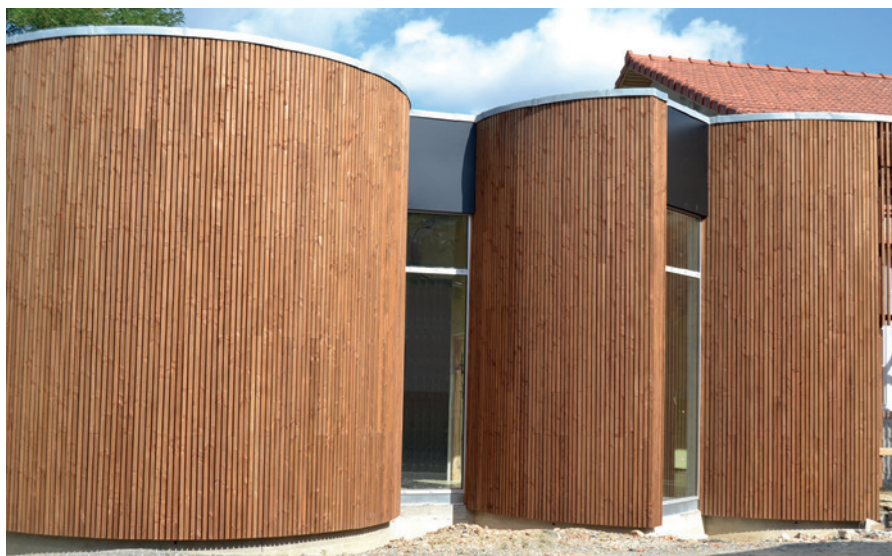
L'extension baroque et le cadrage de ses ouvertures

L'ancienne gare de Briatexte, transformée en maison d'habitation, accueille aujourd'hui les nouveaux locaux de la médiathèque, résultat d'une volonté de réinvestir et de valoriser des locaux communaux. Un renouveau pour ce bâtiment à l'image sociale fortement ancrée, dont il s'est agi de respecter le caractère d'origine et d'affirmer sa vocation d'équipement public, tout en le liant au cœur de bourg.