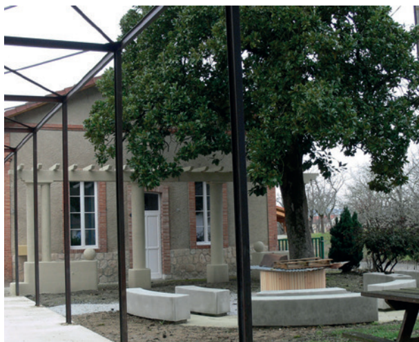
Le jardin de lecture