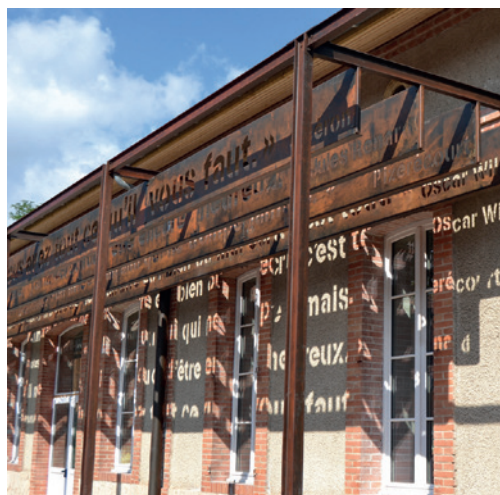
La pergola et son travail de calligraphie