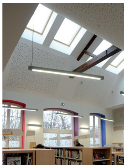
Le puits de lumière dans la salle de prêt