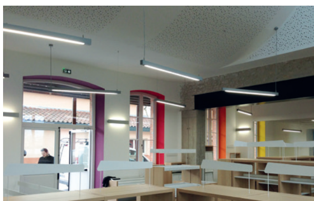
Jeu de couleurs dans la salle de prêt

Du bâtiment existant les murs extérieurs et la charpente ont été conservés pour accueillir un espace généreux dédié à la salle de prêt et aux animations. Ici le rapport à l'extérieur, le cadrage sur la nature ou le captage de lumière est un jeu qui a induit les volumes des pièces et les proportions des nouvelles ouvertures. En toiture, un puits de lumière au Nord capte la luminosité constante. Au sud, la pergola d'aspect rouillée apporte ombre et jeu de lumière sur sa façade qui semble calligraphiée.