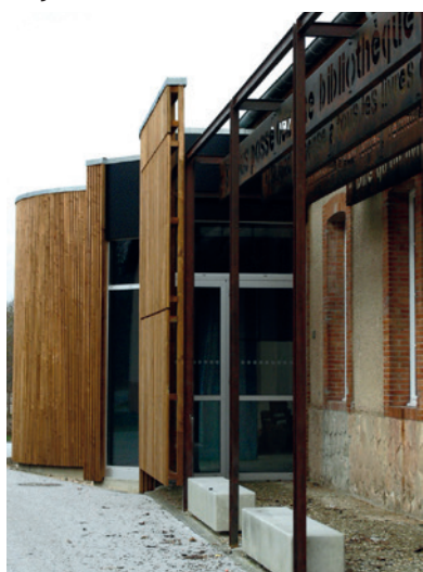
L'entrée et les volumes baroques de l'extension