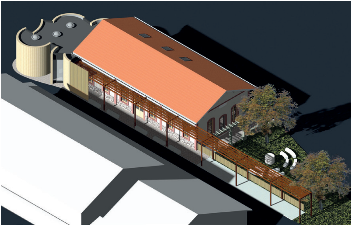
La médiathèque participe avec la salle des fêtes à l'espace culture et loisirs