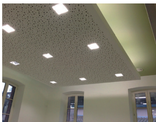
Travail sur la lumière et le confort acoustique