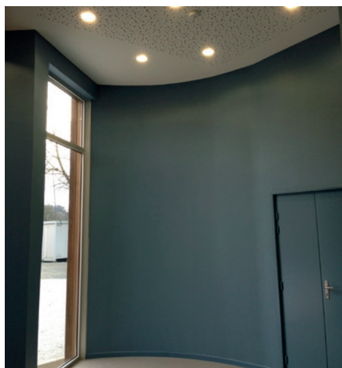
Les volumes arrondis du hall d'accueil