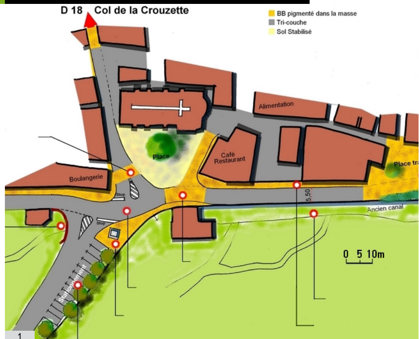
1. Proposition d'aménagement pour la commune de Biert, Ariège

La municipalité, dans un souci de sécurité, a souhaité mener une réflexion sur les moyens à mettre en place pour limiter la vitesse à l'intérieur de l'agglomération. Pour cela, elle s'est rapprochée en premier lieu, de la direction des infrastructures au Conseil général de l'Ariège.