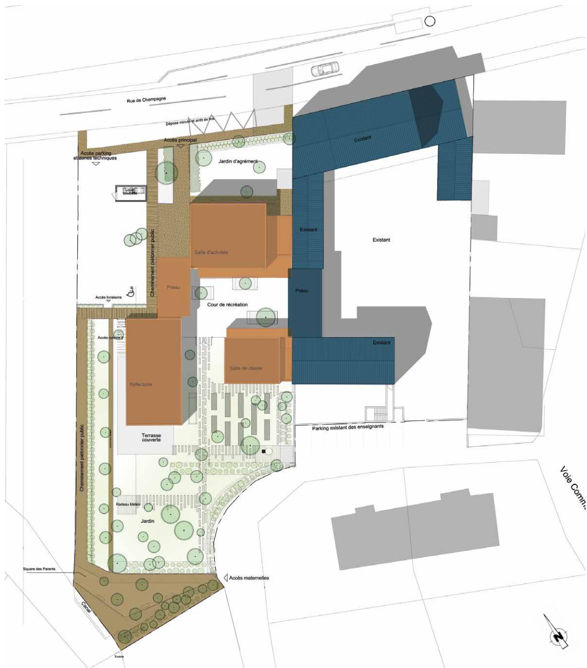
Plan de masse