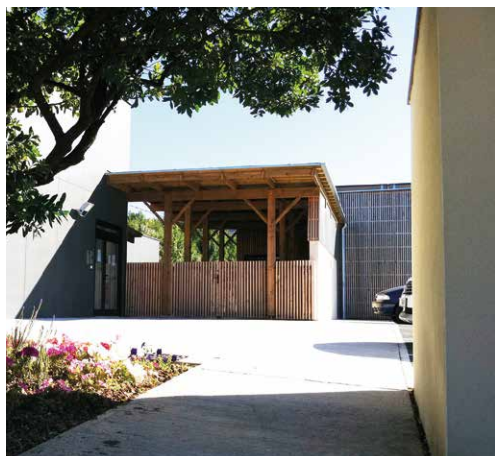
Le parvis d'entrée