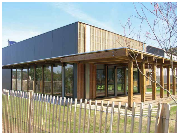
Vue depuis le cheminement piéton sur le réfectoire

La nouvelle salle de classe s'implante dans la continuité de celles existantes. La salle d'activité a une position stratégique, pouvant être utilisée de façon autonome, elle est en limite de parcelle et ouverte sur un parvis. Le réfectoire, à l'inverse, trouve sa place au milieu du verger existant. L'ambition du projet était également de créer un accès unique à l'école et de donner la possibilité aux habitants du quartier de traverser la parcelle, afin de créer une perméabilité dans ce tissu urbain fermé.