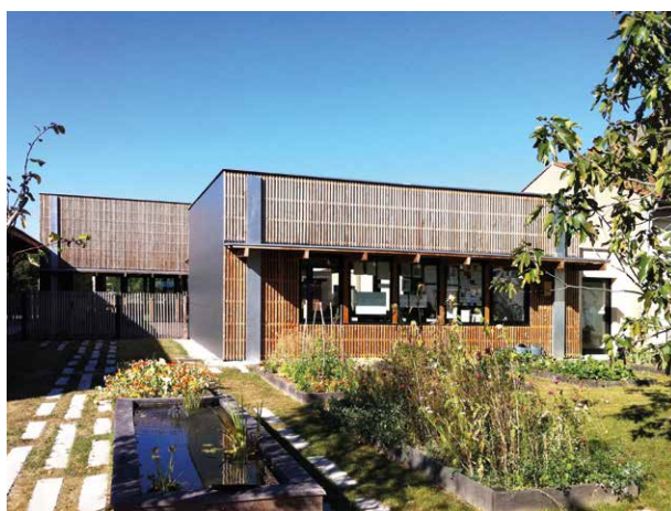
La salle de classe ouverte sur le potager