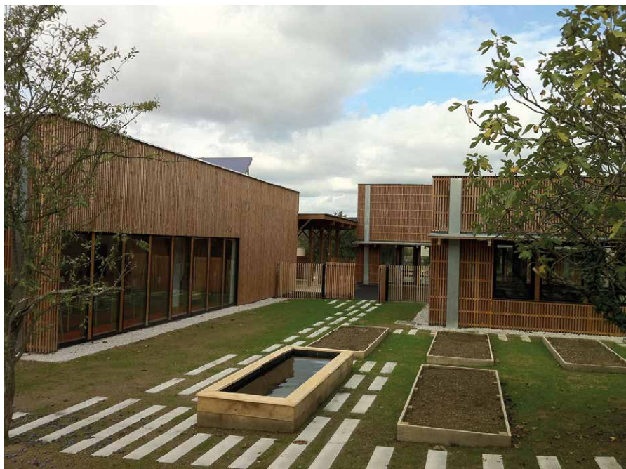
Le potager, entre la salle de classe et le réfectoire

L e projet consiste à redonner une cohérence au groupe scolaire en terme d'usage et de relation avec le village, en intégrant au programme une salle d'activités et un réfectoire. Afin d'intégrer au mieux les constructions et de privilégier la conservation du potentiel végétal du site, 3 entités séparées composent le projet.