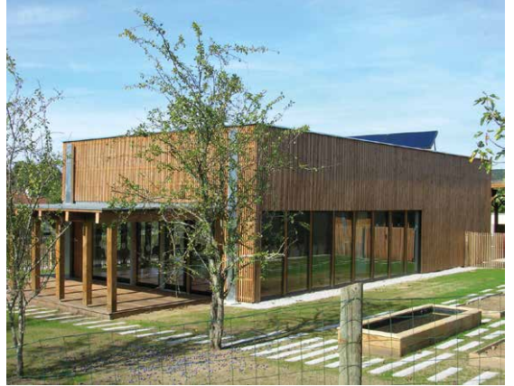
Le réfectoire et sa terrasse couverte