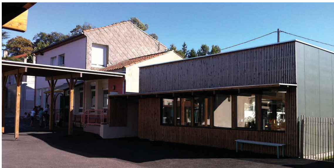
La salle de classe depuis la cour de récréation