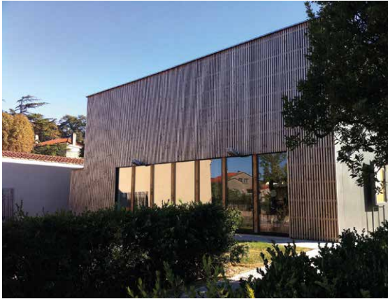
La salle d'activité