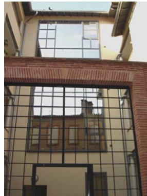
Détail du porche d'entrée