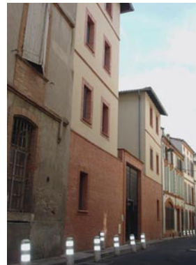
Insertion de l'immeuble dans le tissu ancien

Le projet d'agrandissement et de réhabilitation des 25 logements du 7 rue Lasserre est complexe, tant dans sa structure en respect au cahier des charges de Tarn-et-Garonne Habitat que dans l'adaptation aux normes d'habitabilité des logements existants insalubres.