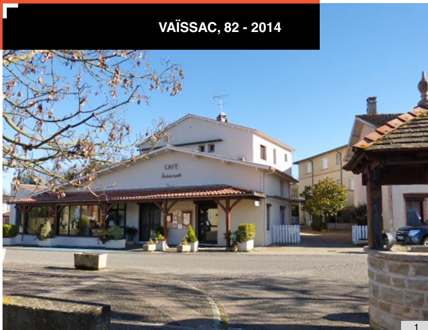
1. Vue de l'hôtel-restaurant depuis la place du village