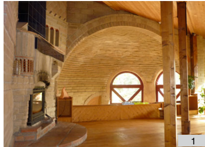
1. Centre de terre, Verfeil, 31, Joseph Colzani architecte 2. Exposition Projet culturel, Babeltut scénographes 3. Conférence CAUE sur l'actualité de la terre crue