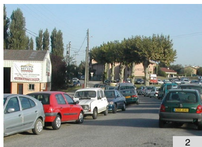
1. Vue du parking de la gare de Dieupentale aménagé 2. Abords de la gare de Grisolles avant travaux