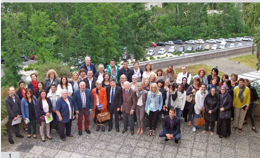
1. Participants de l'opération "Famille à énergie positive", lors de la réunion de clôture au Conseil départemental le 26 mai 2016

Le CAUE-EIE 82 a aidé 6 pôles sociaux de Tarn-et-Garonne dans leur déclinaison de l'opération nationale "Familles à énergie positive", menée par l'ADEME et conçue par l'association Prioriterre.