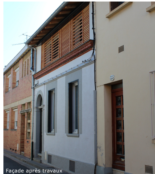
Façade après travaux