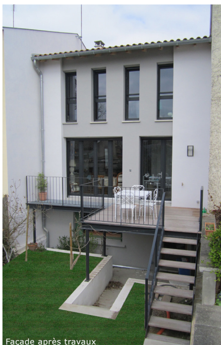
Façade après travaux