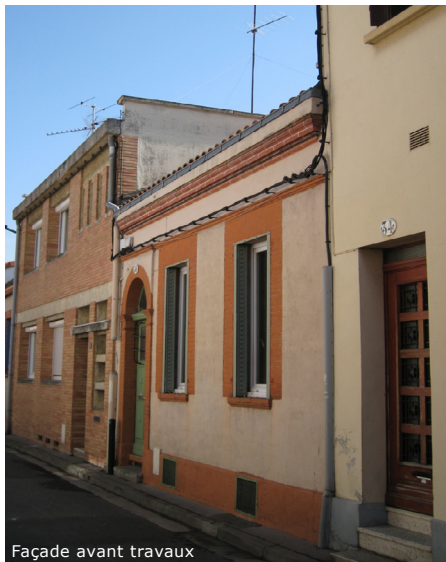
Façade avant travaux

Côté jardin, la façade est entièrement redessinée. Les ouvertures du rez-de-chaussée et du premier étage sont en léger retrait, sur une trame identique. Le sous-sol, situé au niveau du rez-de-jardin, est travaillé comme un soubassement. Une terrasse en bois et un balcon en caillebotis métallique viennent en continuité des pièces de vie du rez-de-chaussée, sans assombrir le niveau inférieur.