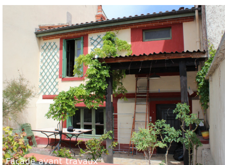
Façade avant travaux