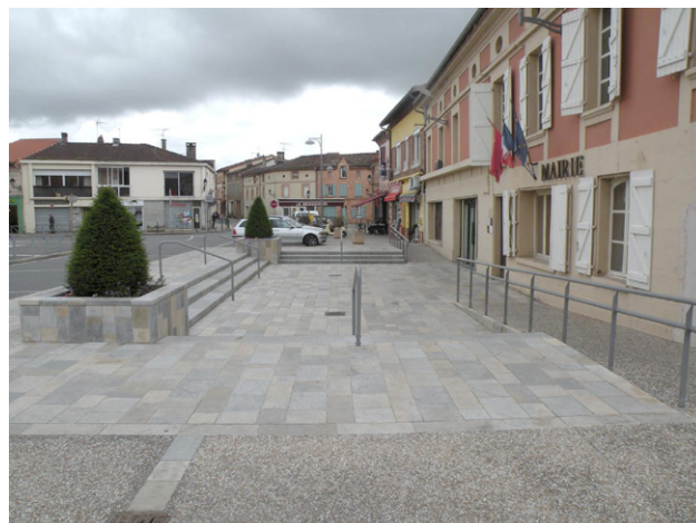
3. Composition en "amphithéâtre" du parvis de la mairie pour absorber la différence de niveaux

Le parvis de la mairie, en forme d'amphithéâtre faisant la jonction entre différents niveaux, illustre ce "modelage".