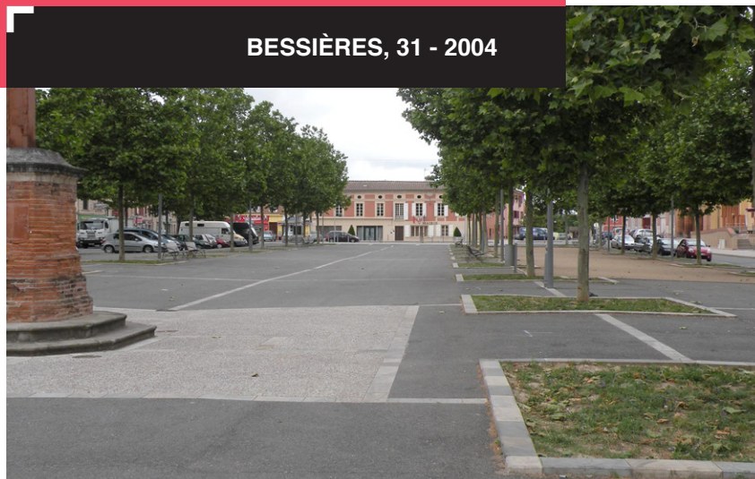
1. Perspective vers la mairie, traitement de sol soigné autour des arbres replantés