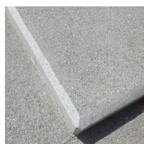
Détail Chanfrein 8