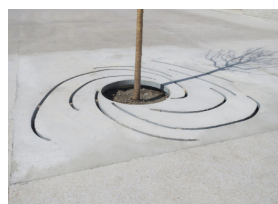
Détail entourage arbre 9