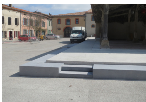
7 Pied Halle