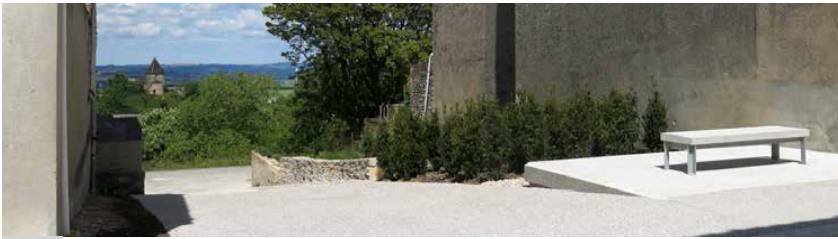
4 Belvédère des Trois moulins