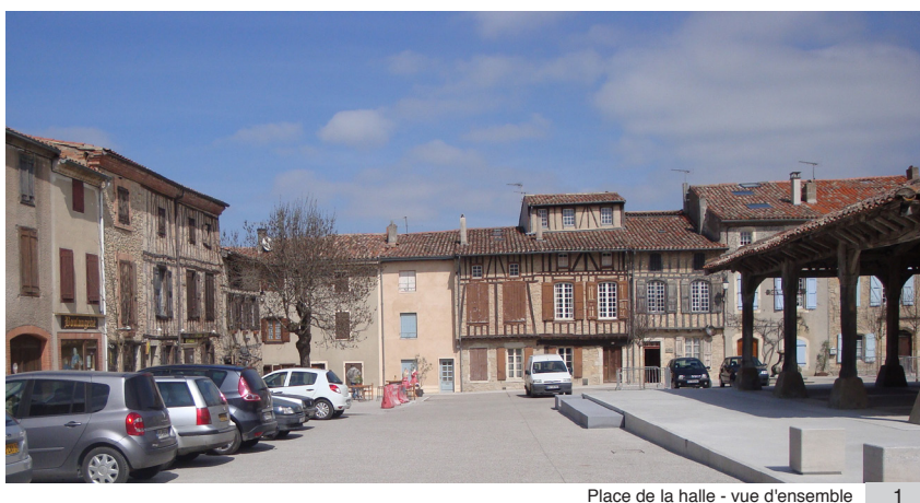
Place de la halle - vue d'ensemble 1