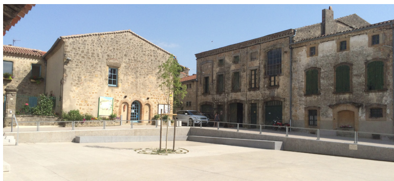
2 Place de la halle - vue d'ensemble