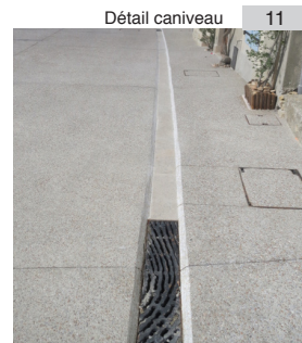
Détail caniveau 11