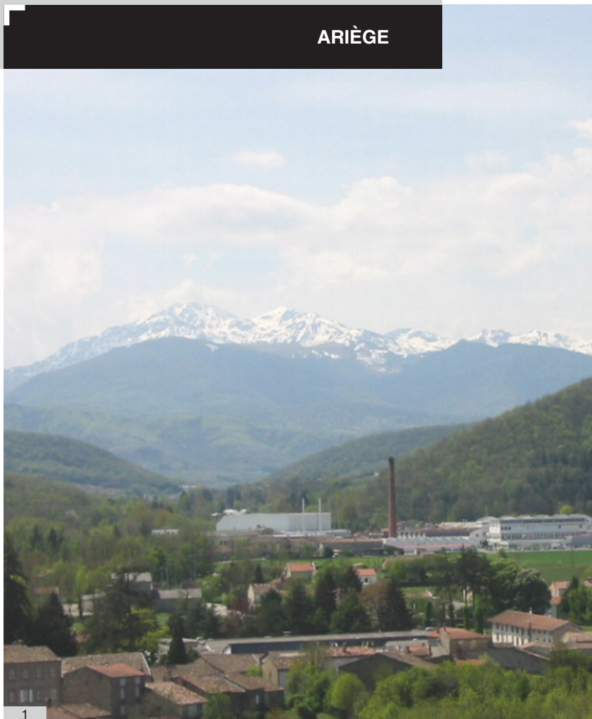
1. Massif du Tabé, Montségur, chaînons du Plantaurel, usine textile et bourg de Laroque d'Olmes implantés au niveau de la cluse du Touyre.

Le versant nord du massif du Tabé limite l'entité au sud. Celle-ci se structure ensuite autour des deux barres gréseuses et calcaires du Plantaurel, à l'extrémité est du département.