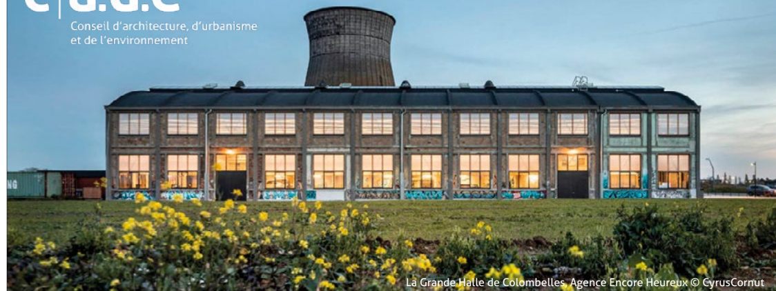
La Grande Halle de Colombelles, Agence Encore Heureux

Présentation des freins au réemploi dans le domaine assurantiel, normatif et de contrôle. Quelles perspectives et opportunités pour demain ?