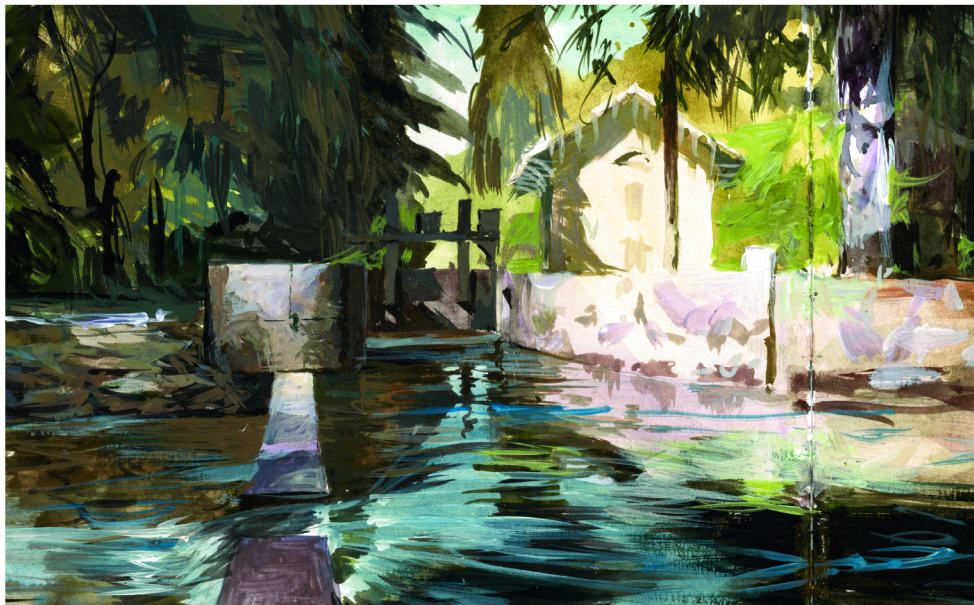
Illustration © Christophe Pons-Capitaine

13 avril - 15 mai Mairie / Labastide St-Georges