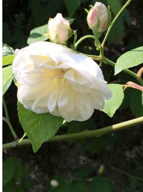
« Blanche de Chédigny »