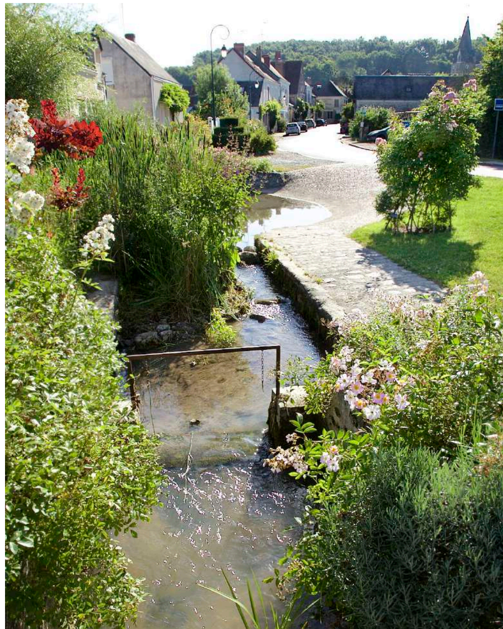
2005 - 2008 : Aménagement des entrées de bourg