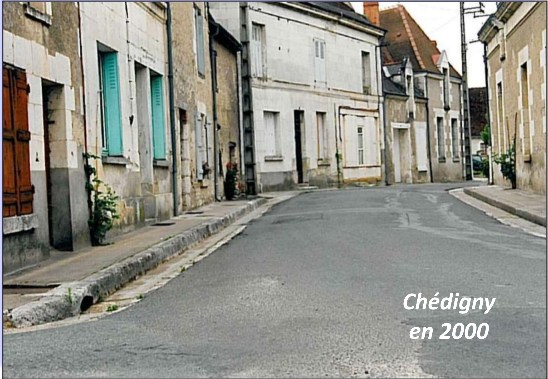
Chédigny en 2000