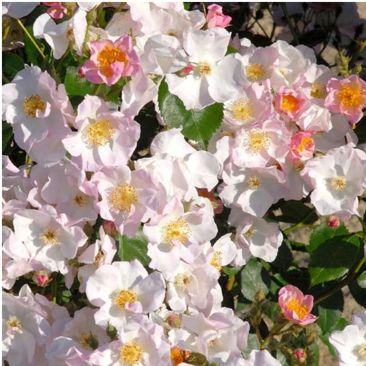
« Jeanne de Chédigny »