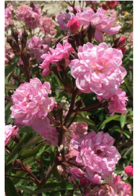
petite coquine de Chédigny