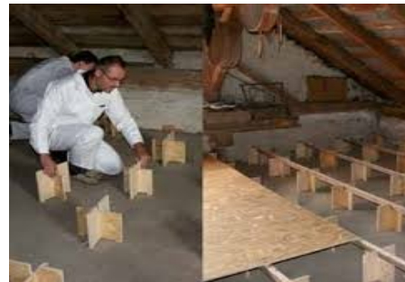
pose double plancher