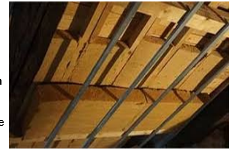
Isolation sous rampants

Pour certaines toitures il est nécessaire de conserver une lame d'air ventilé entre les tuiles et l'isolant afin de limiter la surchauffe l'été.