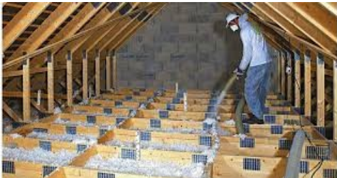
Isolation combles perdus

Si on souhaite conserver un stockage dans les combles, il est possible de mettre en place un double plancher sur le plancher existant. L'isolant sera insufflé entre les 2 planchers.