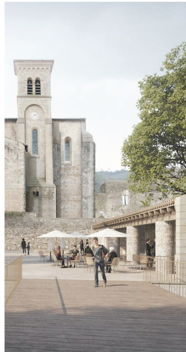
ETUDE OPERATIONNELLE (étude Ilot Nord à Saint-Hilaire)