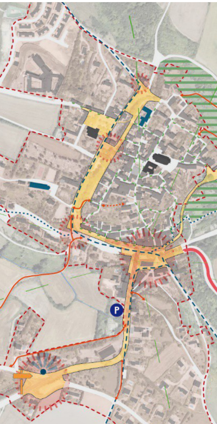
ETUDE PROSPECTIVE (étude Bourg Centre de Fanjeaux)