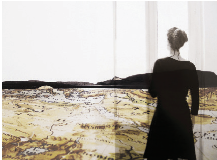
« Vous êtes ici »

Dans le cadre du Mois de l'Architecture 2019, le CAUE de l'Aude propose des rendez-vous pour tous publics autour de l'architecture, du paysage et de la « frugalité heureuse ». Avec, en ouverture, une remarquable exposition de photographies de l'artiste Sylvie Romieu.