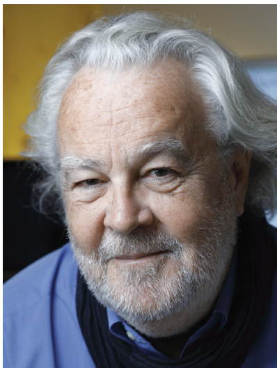
Philippe Madec

Tarif : 255 euros (prise en charge par Uniformation pour les salariés membres du réseau des CAUE). Inscription en ligne sur le site de la FNCAUE (complet)