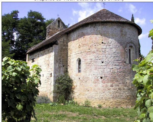
Chapelles du Bouzonnet (Bouzon-Gellenave, Pays d'Aignan)