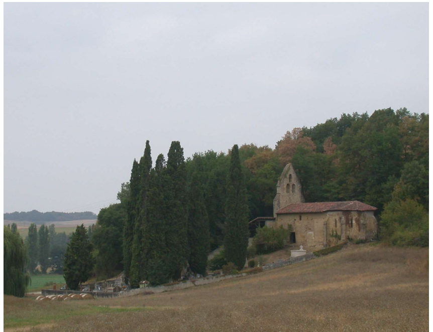
Chapelle de Saint-Martin à Crastes (Pays d'Auch) et Chapelle de Brétous à Saint-Arilles (Pays d'Anglès)