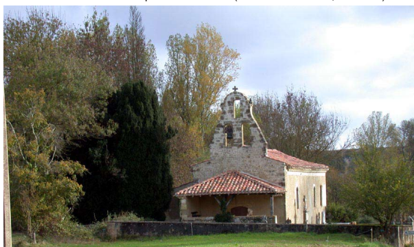
Clocher-mur de la chapelle d'Aracamont à Roquelaure (Pays d'Auch)