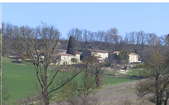
Hameaux en contrebas des rebords des plateaux lomagnols