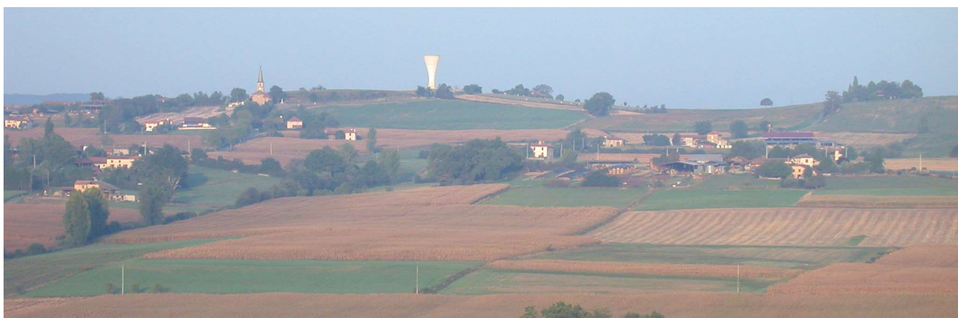
... où au contraire une simple concentration et juxtaposition d'ancienne fermes (ici un «quartier» à Duffort)