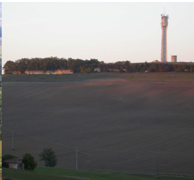
Château d'eau de Roquelaure sur un petit plateau sommital avec un ancien moulin à vent