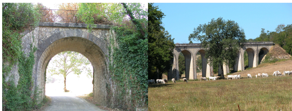
Ponts ferroviaires abandonnés