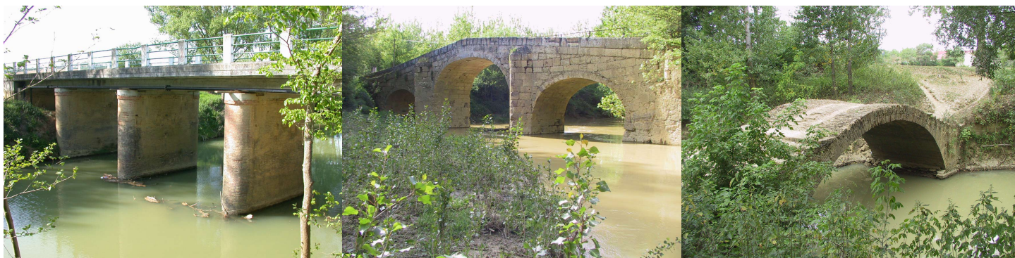
En briques, en pierre , utilisé ou abandonné