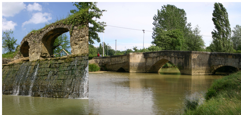
Monument historique, en ruine à Mazère, en service à Pavie