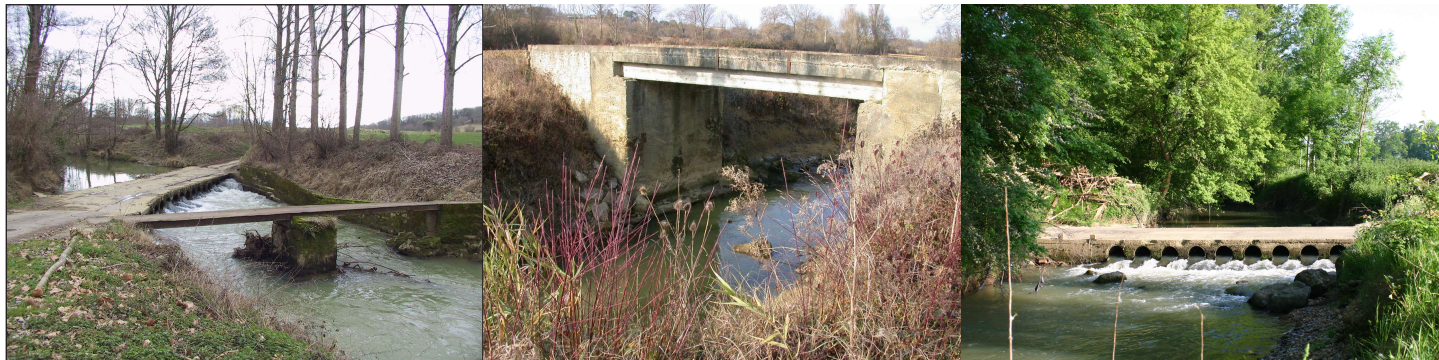
Passage à gué, pont à usage agricole...