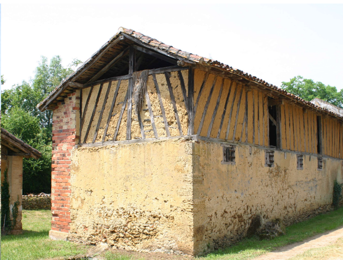
Grès et trochis en armagnac