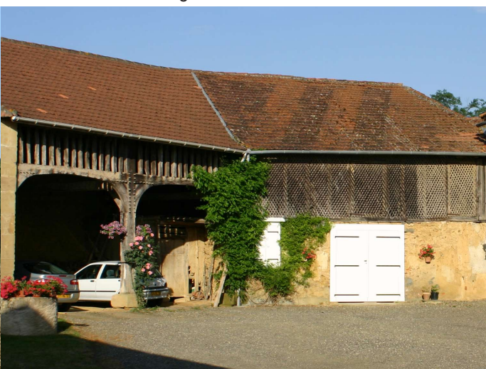
Treillage de bois en Astarac