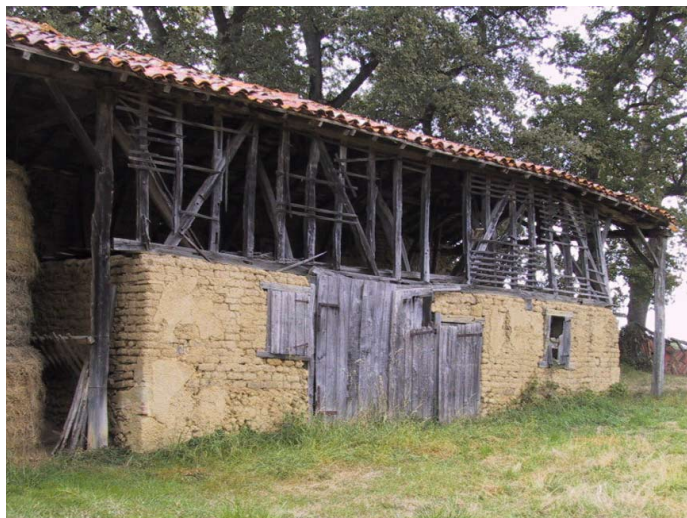
En terre crue en Astarac