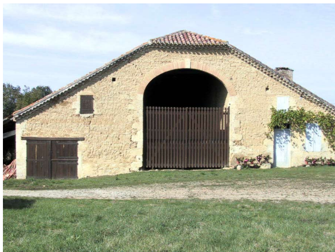
Briques crues et pierre calcaire en Lomagne