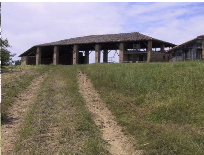
En briques cuites et sur piliers dans le Savès toulousain