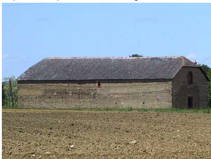
Galets et ardoises, coteaux de Béarn